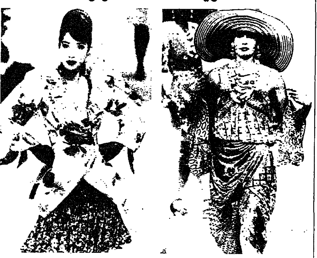
الثوب الضخمة الرغيمة لم تعد مقصورة على الألوان الرصينة والموضة الكلاسيكية. ومن هذا المنطلق جاءت تصاميم أنغلو ولوي فيرو لتتخذ هذا الاتجاه في ازياء الموسم القادم. في الصورة الأولى، ثوب من مجموعة ايمتويل أنغلو قوامه فستان حريري من الأزهار الملونة متعددة الألوان. باريس - ١ ف ب